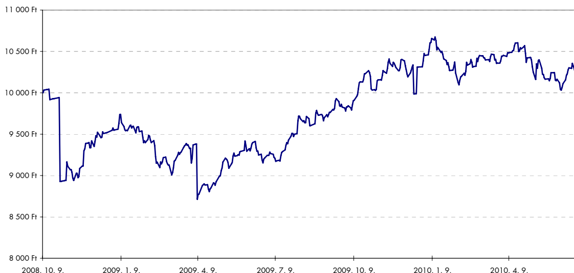
Raiffeisen Univerzum IV. Tőke- és HozamvédeTT Származtatott Alap

Az indexek közül kettő, a Nemesfém index (+12,91%) és az orosz RDX részvényindex (+2,95%) tudott pozitív teljesítményt felmutatni a vizsgált időszak során, de a másik három mutató – százalékban kifejezett – kétszámjegyű esését nem tudták kompenzálni.