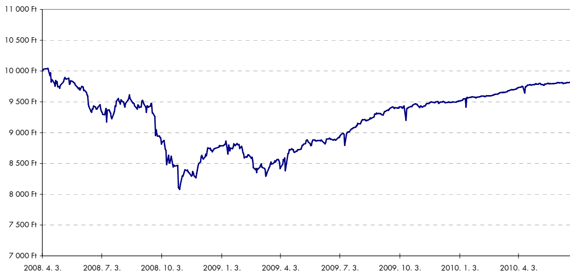
Raiffeisen Univerzum 2 Tőke- és Hozamvédezt Származtatott Alap

A mögöttes indexek teljesítményét alapvetően a részvénypiacok határozták meg, legjobban a fejlődő piacok emelkedtek az előző év intenzív zuhanása után. Ennek megfelelően az EPRA NAREIT index 6,0%-os nominális hozammal zárta az első félévet. Az emelkedésüket támogatta, hogy a világban hirtelen mindenhol nagyon népszerűtlenné váltak az ingatlanokkal kapcsolatos befektetések, akár érintette őket közvetlenül az amerikai jelzáloghitel-piac összeomlása, akár nem, így a visszatérő befektetői bizalom újult erővel találta meg a korábban messzire vetett befektetési eszközöket.